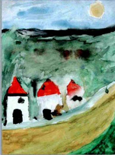
Grundschule Elsenfeld, Klasse 3 c