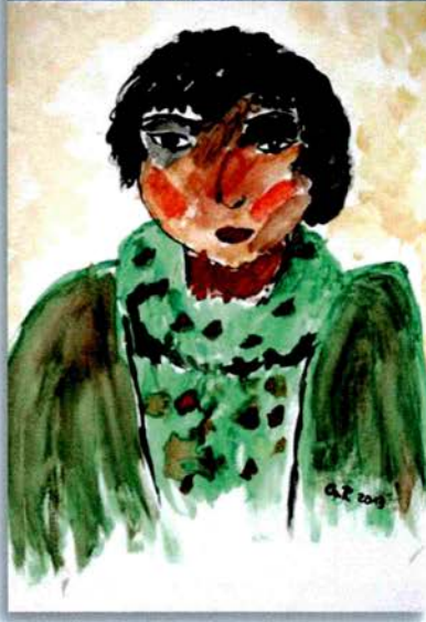
Mittelschule Faulbach, Klasse 8